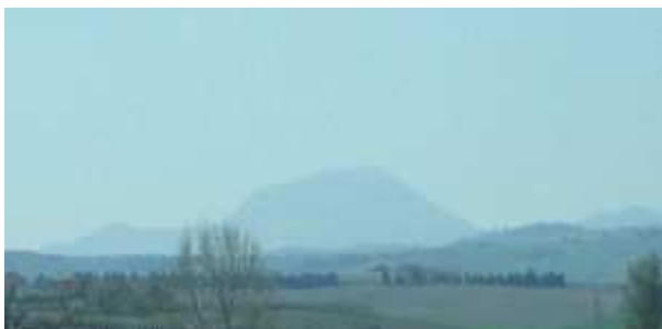
veduta del Monte San Vicino dalla Valle Esino

Questi 2 km sono come pendenze i più facili ma la stanchezza accumulata prima vi renderà questo tratto il più duro anche perché vedrete su questo “ stradone “ lo scollinamento davanti a voi ma che non arriva mai.